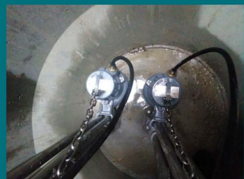
zwei Pumpen in einem Schacht für alternierenden Einsatz

Odermatt Umwelttechnik AG Ergetenstrasse 1, 9203 Niederwil Tel: 071 951 80 50 Info@odrag.ch , www.odrag.ch