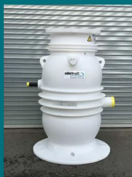
Compitschacht für Abwasser