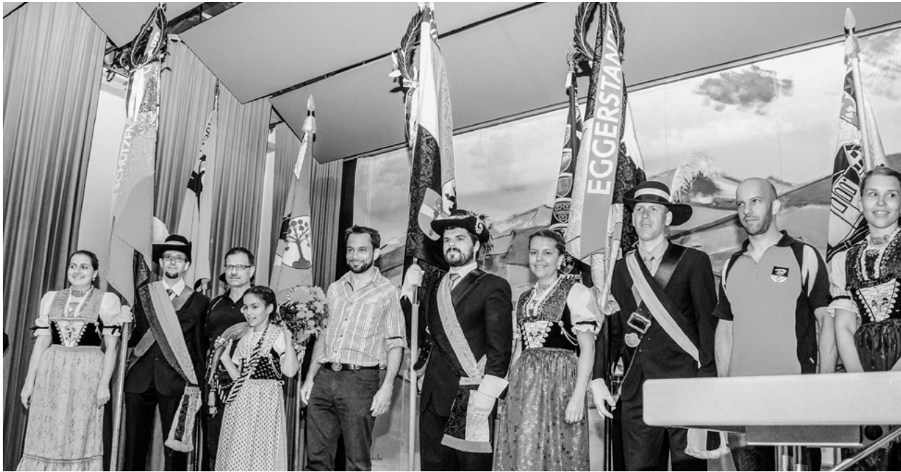
Auszeichnung der bestplatzierten Sektionen.